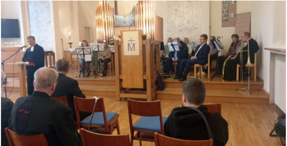
Mit einem Gottesdienst im Lutherhaus begann der Kreismännersonntag in Herne-süd.