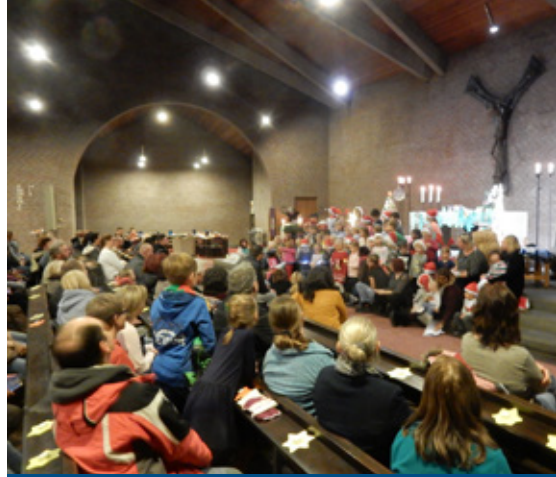
Eltern, Kinder und Angehörige bei einem Familiengottesdienst zum Sternentag in der Dreifaltigkeitskirche am Regenkamp.